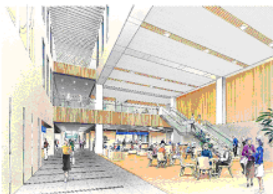
区民ロビー イメージ図