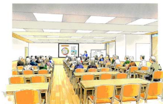
区民交流会議室 イメージ図